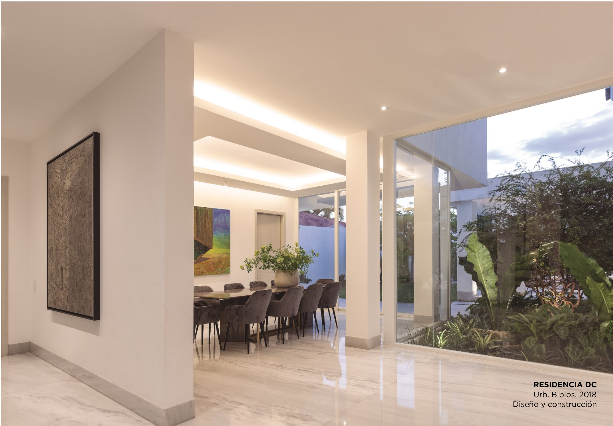
RESIDENCIA DC Urb. Biblos, 2018 Diseño y construcción