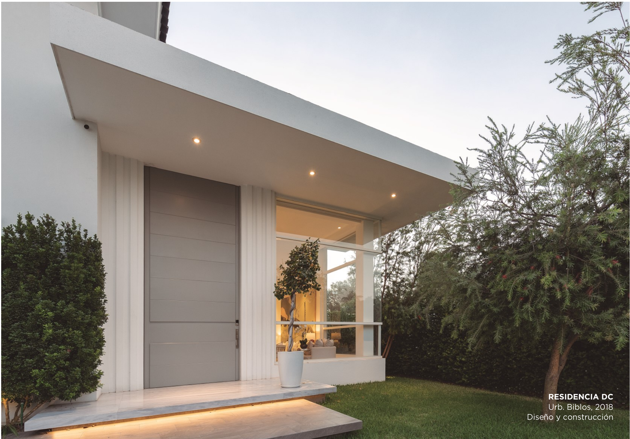
RESIDENCIA DC Urb. Biblos, 2018 Diseño y construcción