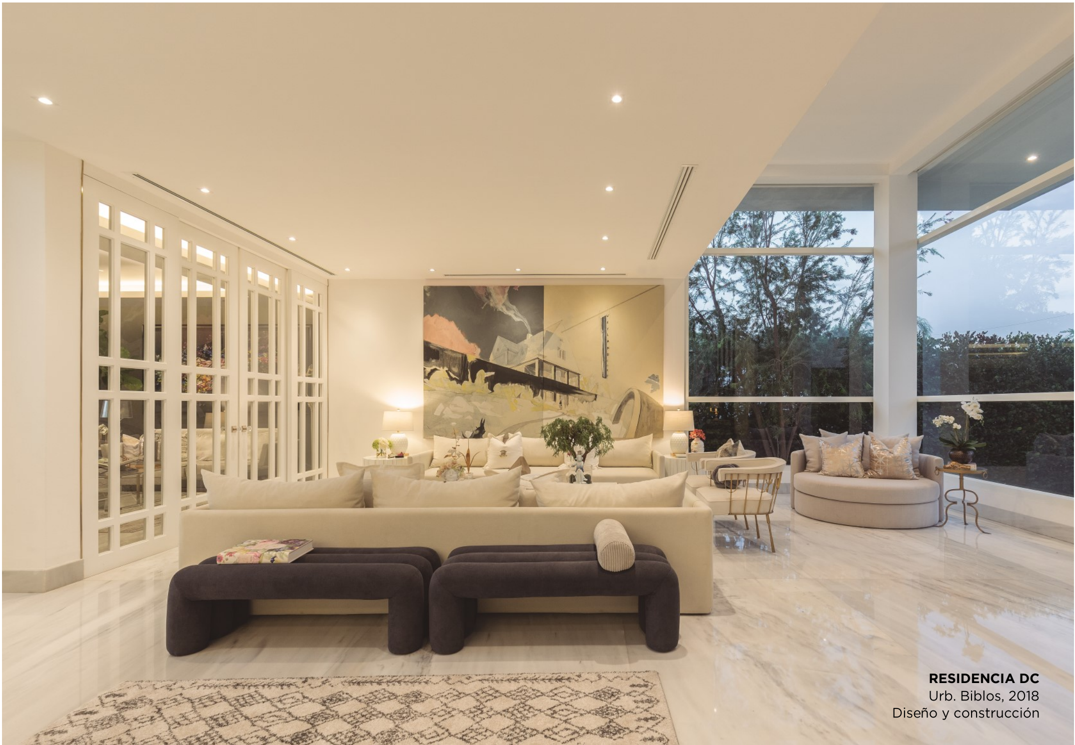
RESIDENCIA DC Urb. Biblos, 2018 Diseño y construcción