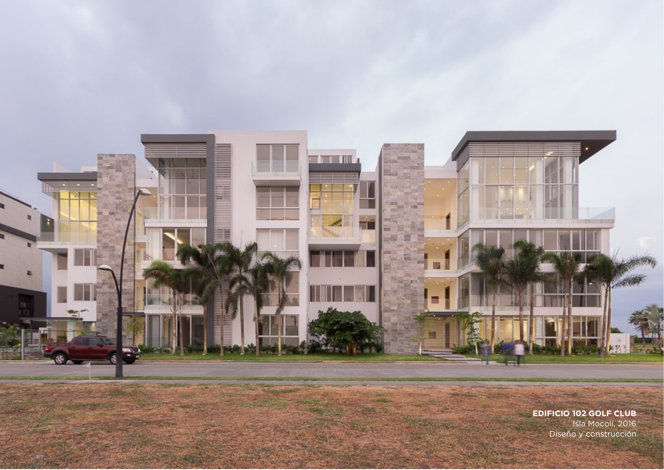
EDIFICIO 102 GOLF CLUB Isla Mocolí, 2016 Diseño y construcción