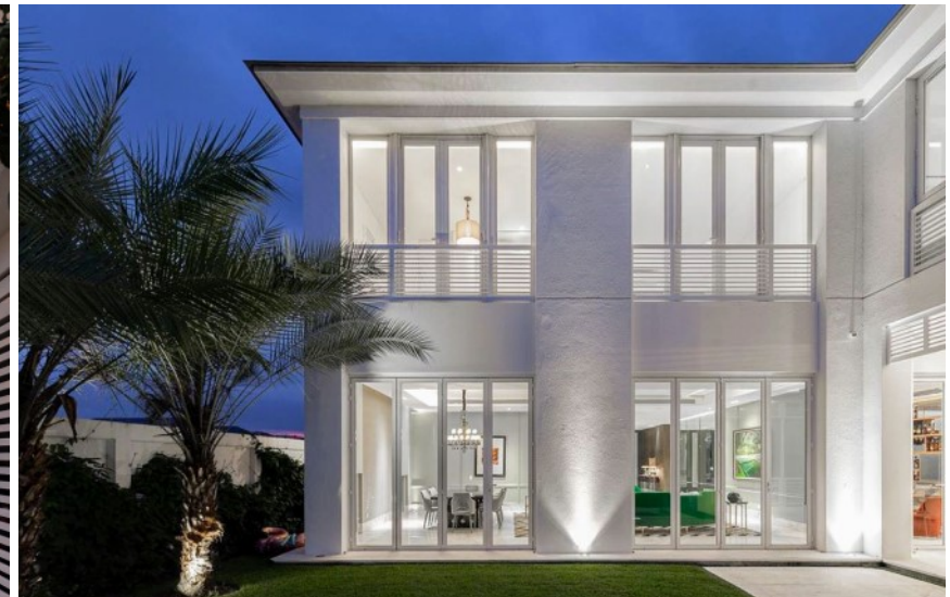
RESIDENCIA CB Aires de Batán, 2018 Construcción (Diseño: Intemperie Studio)